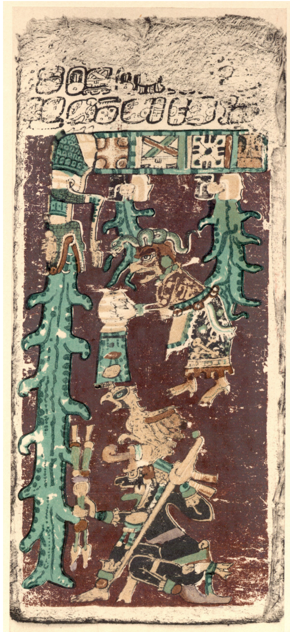
2: Página final del Códice de Dresde