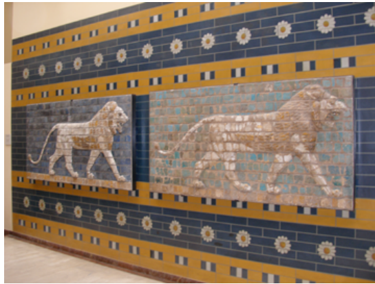
16: Azulejos de la antigua Babilonia (Estambul, 2008)

Las señales serán poderosas. Y la potencia babilónica caerá durante el día del Señor (Apocalipsis 18:2). Como la Babilonia en el libro del Apocalipsis es una ciudad en siete montes (Apocalipsis 17:5-9), según los académicos católicos ésto se refiere a una ciudad como Roma ya que la antigua Babilonia estaba en una llanura.