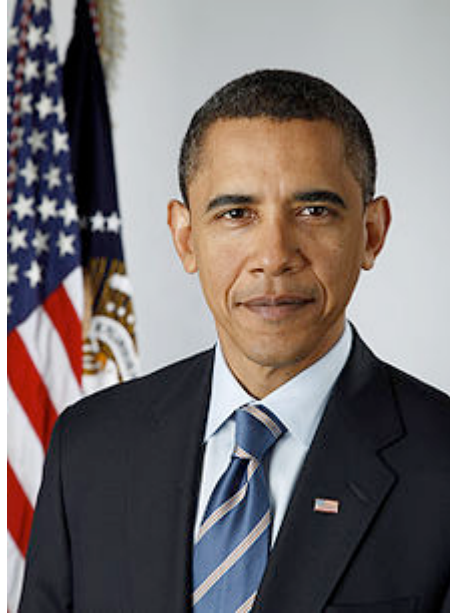
13: Fotografía oficial de Barack Obama, presidente de los Estados Unidos

El 20 de enero de 2009, Barack Hussein Obama se convirtió en el presidente número 44 de los Estados Unidos. Su primer término presidencial incluye el año 2012.