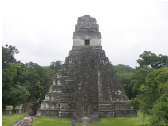
1: Templo maya, Tikal, Guatemala, 2006

Estaban tan obsesionados con la precisión de su calendario que produjeron un calendario que, de hecho, es más preciso que el que la mayor parte del mundo utiliza en el siglo 21.