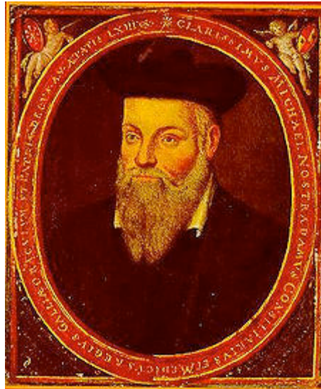
7: Nostradamus: retrato original realizado por su hijo César

Nostradamus es conocido principalmente por su libro, Les Prophéties (Las Profecías), el cual fue distribuido por primera vez en el año 1555. Contenía una serie de 100 conjuntos (llamados centurias) de pasajes poéticos (llamados cuartetos) de cuatro versículos. Muchos creen que Nostradamus escribía manera críptica para protegerse de las autoridades del gobierno/iglesia y tratar a preservar su vida. Otros creen que fueron escritos de manera críptica para que estuvieran sujetos a cualquier interpretación, y por lo tanto carecen de un verdadero valor predictivo.