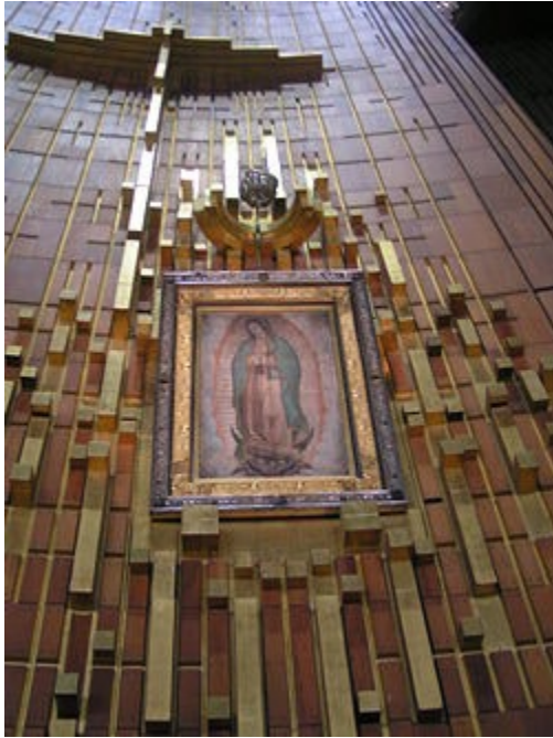
Anayedaiwa kuwa ni 'Mama wa Guadalupe', Mexico City

Maono ni kitu gani? Je, maono yameubadiri ulimwengu? Je, maono ni swala linalokubaliwa na Biblia kuwa ni takatifu? Je, madai ya watu kutembelea maono ni swala la Wakatoliki pekee ama limeliathiri hata Kanisa la Mungu pia? Na kama ni hivyo, limeliathiri kwa namna gani?