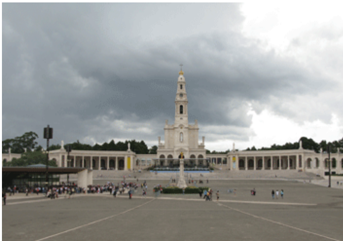
Madhabahu ya Fatima, Ureno