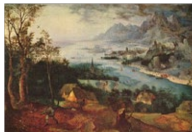
Pieter Bruegel's Landschaft mit der Parabel vom Sämann, 1557