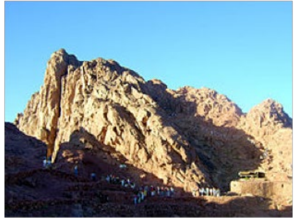
Gipfel des Mt. Sinai

Von Leroy Neff (Ursprünglich veröffentlicht als Teil des Artikels God's Holy Days: The Master Builder's Blueprint in der Good News , August, 1980)