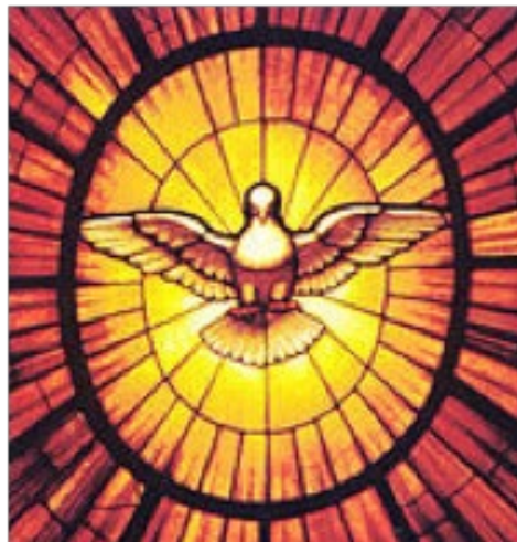
Der Heilige Geist kam auf Jesus hernieder wie eine Taube (Matthäus 3:16)

Von John Ross Schroeder (Ursprünglich veröffentlicht als Teil des Artikels God's Annual HOLY DAYS: Sneak Preview of Your Future! in der Plain Truth, March, 1979)