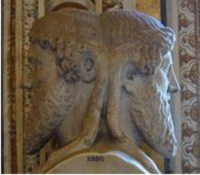
वेटिकन संग्रहालय में रोमन भगवान जानूस बिफरॉस