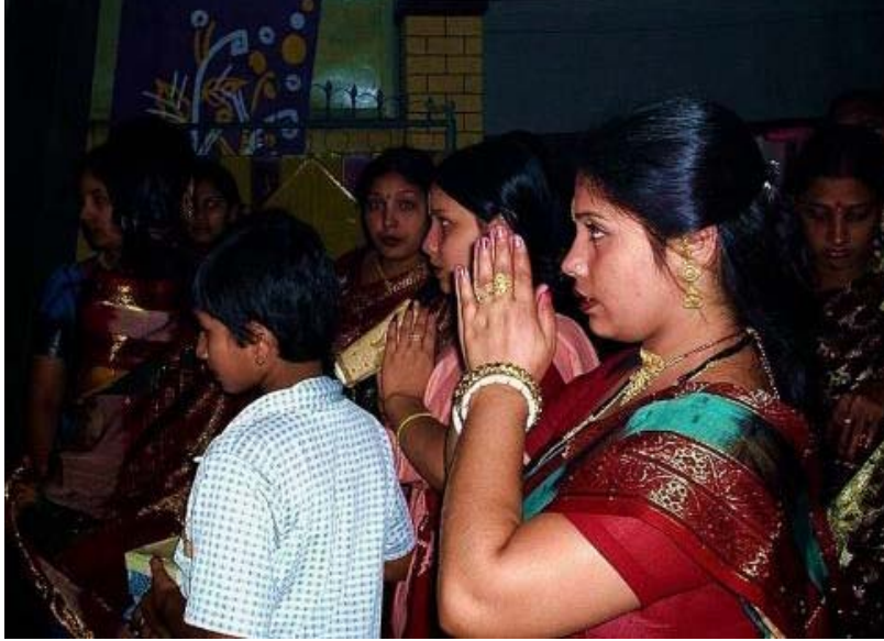
हिंदुओं देवी दुर्गा से प्रार्थना (हसन इकबाल वामी द्वारा)

जहां तक अन्य पदों पर जाने के रूप में, कुछ लोगों को, क्योंकि शारीरिक दुर्बलता की, घुटना टेकना नहीं कर सकते हैं या भी खड़े हो जाओ। भगवान की क्षमता को सुनने के लिए और प्रार्थना के जवाब देने के लिए इस तरह की परिस्थितियों से सीमित नहीं है।