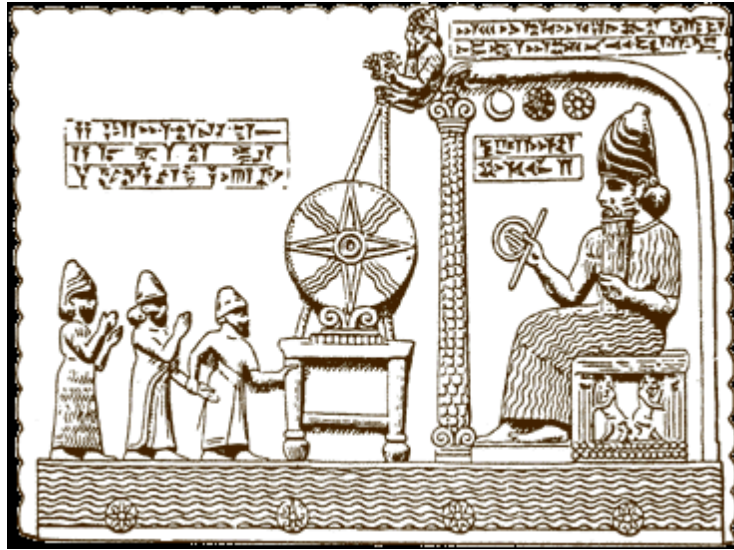
सूरज प्रतीक और शमाश से पहले प्रार्थना पुजारी

बाइबिल जमीन को छू सिर के साथ, घुटना टेककर, खड़े नीचे झुकने या गिराया जबकि दिया प्रार्थनाओं का वर्णन है। कभी कभी बाइबिल हाथ हालांकि हमेशा नहीं उठा रहे हैं पता चलता है। अभी तक कहीं नहीं बाइबिल में सूर्य देवता शमाश ग के लिए प्रार्थना कर रही बेबीलोन पुजारियों के लिए एक तरह, इतने सारे धार्मिक चित्रों या कलाकृतियों पर दिखाया जाता है के रूप में उंगलियों के ऊपर की ओर इशारा के साथ मिलकर हथेलियों के साथ हाथों में हाथ डाले का कोई उल्लेख नहीं है। 888 बी.सी.