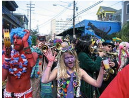
Mardi Gras de Nueva Orleáns