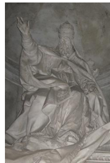
Sacerdote de Mitras Papa León I (siglo 3o.) 1585)