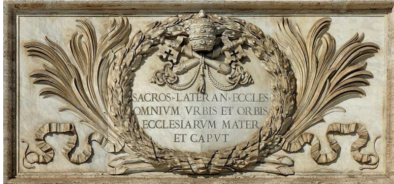
Inscripción en la Basílica de San Juan Laterana

Abajo está la inscripción traducida del latín: