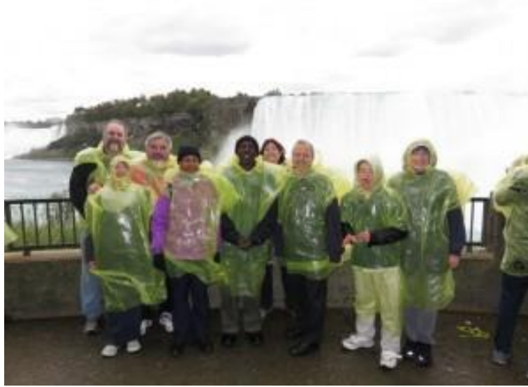
المسيحيون نشاطا خلال عيد المظال في كندا

بقدر ما يذهب اللباس، وأساسا نحن نتوقع من الناس ارتداء ملابس نظيفة (محض لا غير صحيح أو ضيقة) واللباس بشكل جيد، ولكن ليس أكثر لطيف من أنها يمكن أن تحمل إلى حد معقول. إذا كنت تفعل ذلك، لتلبية ما يعلمه الكتاب المقدس (على الرغم من وأود أن أضيف أن معظم يستطيعون شرائه العلاقات المستعملة، والتي هي جزء من الثقافة الغربية).