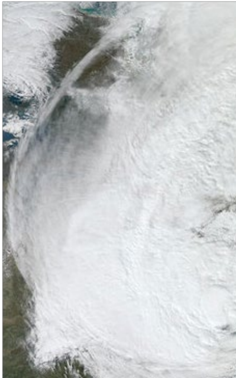
Matinding Bagyong Sandy