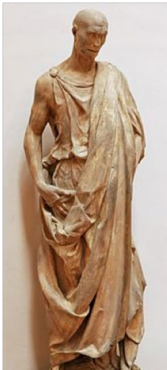
{Statue Intended to be Habakkuk by Donatello, from page 7} Rebulto na Nilayong Maging Habakkuk Sa Pamamagitan Ni Donatello (ika-15 na siglo)

Si Habakkuk ay isang Hebreo na propeta. Ang ilan sa mga tao ay inobserbahan ang pang-alaala sa kanya sa Enero 15. Inulat sa Jewish Encyclopedia ng 1906 na itoang tungkol sa kanya: