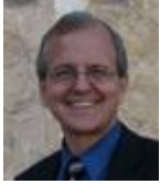
KUTOKA KWA MHARIRI MKUU: BOB THIEL